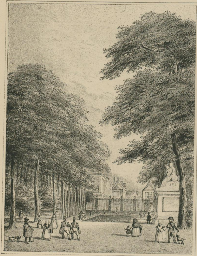
LE PARC A 9 HEURES DU MATIN. (VUE DE L'ALLÉE ABOUTISSANT A LA MONTAGNE DU PARC.) D'après la lithographie de Borremans et Baugniet.

donnait le vaudeville et la comédie deux fois par semaine, le samedi et le dimanche. Le théâtre du Parc avait été construit en 1782 d'après les dessins de Montoyer et restauré à maintes reprises. En décembre 1845, le conseil communal adopta le plan proposé par M. Partoes pour sa restauration définitive. La salle, petite, fort incom-